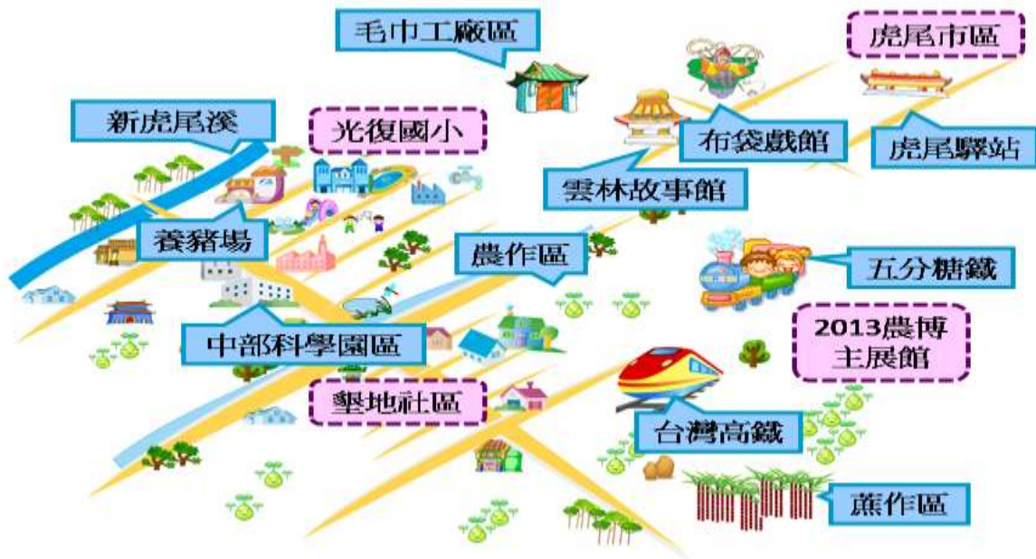
▲ 雲林縣光復國小周邊資源分布圖

光復國小位於雲林縣虎尾鎮，處於與其他鄉鎮的交界，本就是台糖的蔗作區及多條五分鐵道的交會點，現代化的科學園區、台灣高鐵又比鄰而居，加上原本就有的農業資源、未來即將動工的農業博覽會場館、虎尾鎮上既有的豐富文創資源，讓光復國小儼然擁有了一個得天獨厚且獨一無二的藏寶庫，本校環境資源：